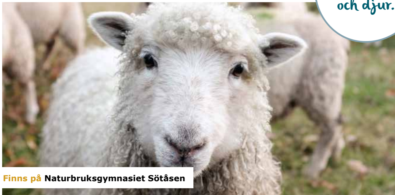
Finns på Naturbruksgymnasiet Sötåsen