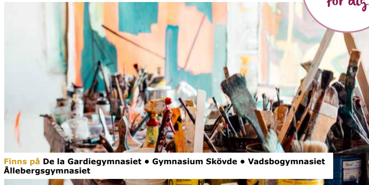
Finns på De la Gardiegymnasiet • Gymnasium Skövde • Vadsbogymnasiet Ällebergsgymnasiet