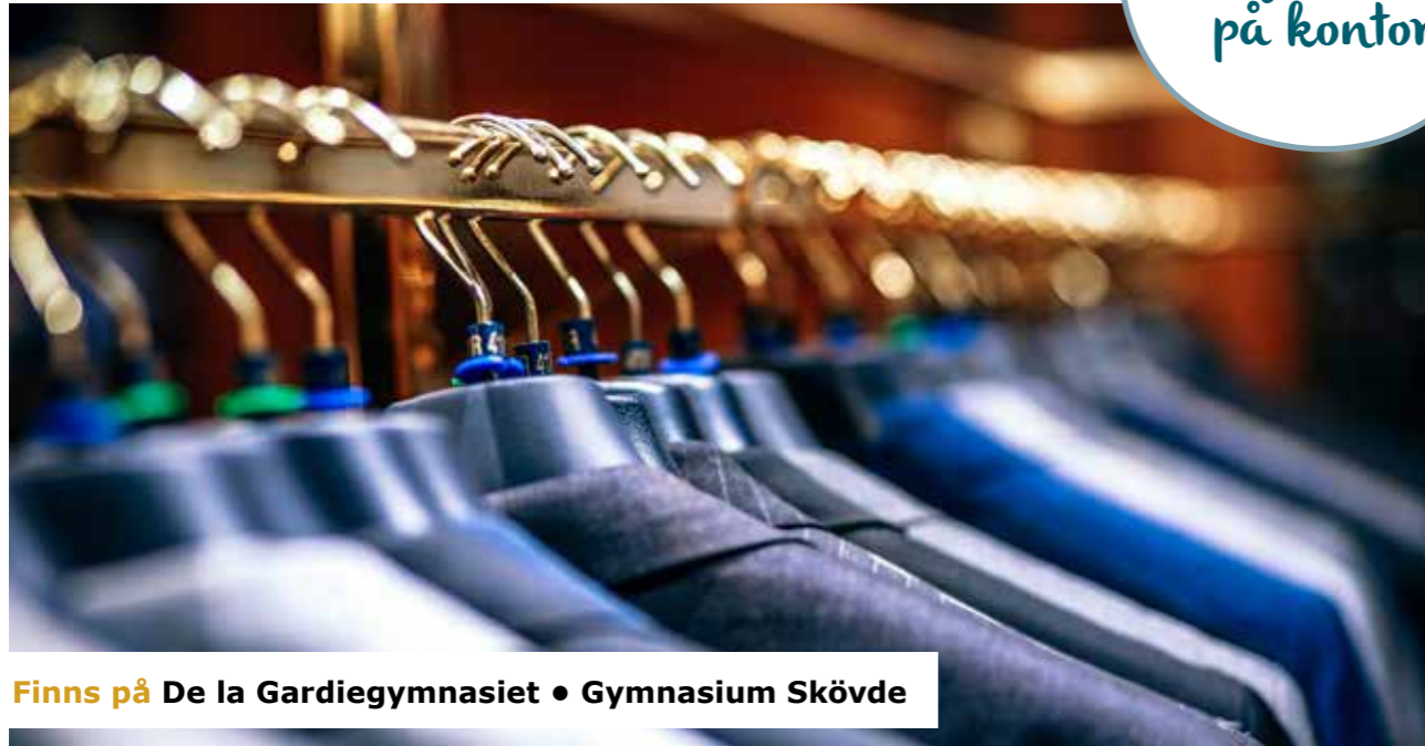
Finns på De la Gardiegymnasiet • Gymnasium Skövde

Programmet passar dig som gillar service, ordning och att träffa människor. Det kan till exempel förbereda dig för arbete inom försäljning, inköp och varuflöden.