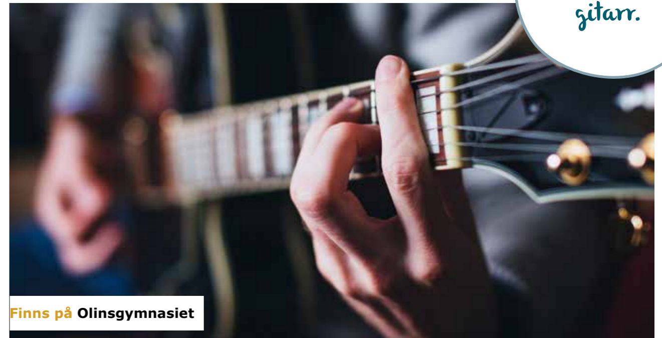
Finns på Olinsgymnasiet

Här får du arbeta med konstnärliga uttryck. Det kan handla om allt från att dreja krukor till att trycka på textil eller spela instrument. Kolla på den skola du tänker söka vilken fördjupning de har.